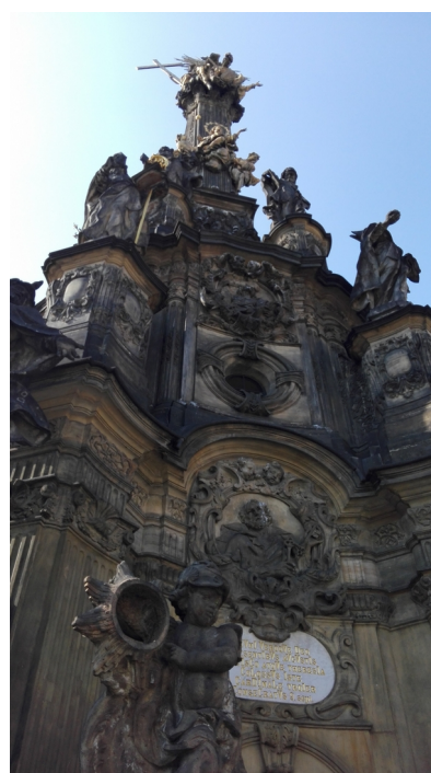
Obrázek 2: Olomouc- detail Sloupu Nejsvětější Trojice, foto MK