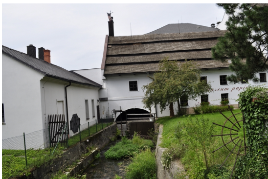
Obrázek 4: ruční papírna a muzeum papíru ve Velkých Losinách