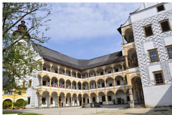
Obrázek 3: zámek Velké Losiny

renesanční zámek, ruční papírna, lázně, termály, pralinková cukrárna :-)