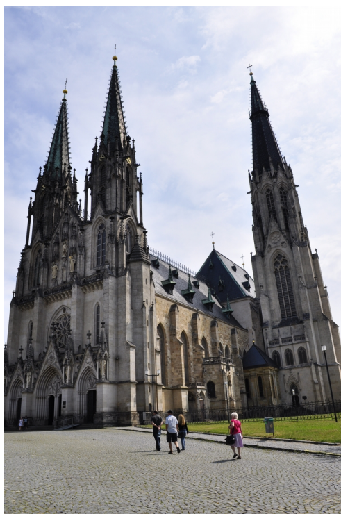
Katedrála Svatého Václava, Olomouc