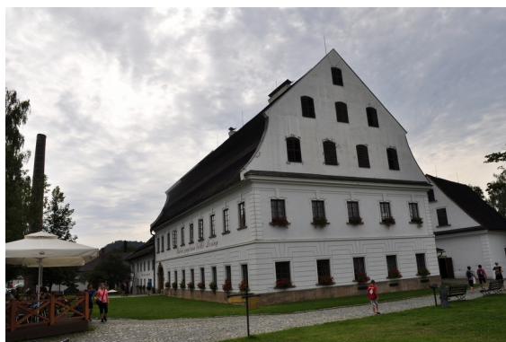
Obrázek 5: Ruční papírna velké Losiny