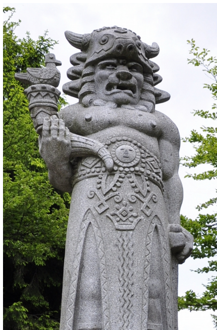
Obrázek 1: část sochy Radegasta a Radhošti

Už jsme si říkali, že Staří Slované věřili v mnoho bohů. Jedním z nich byl například Radegast (obr. 1) – Bůh slunce, hojnosti a úrody.