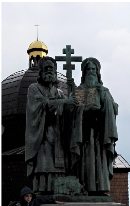
Obrázek 2: sousoší svatých Cyrila a Metoděje před stejnojmennou kaplí na Radhošti

koukněte na video: https://www.youtube.com/watch?v=AsZ3BKahhE8